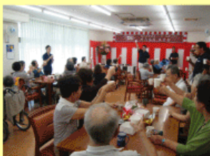
▲健康長寿を祝して乾杯!敬老会の様子。