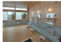
▲リフレッシュ効果抜群のお風呂

ゆめの園が手がける練馬区内デザイナーズセンター第2弾がいよいよ始動いたしました。まだまだ皆様にご覧いただく写真は少ないですが、随時ホームページを通じてお知らせしていきます。どうぞご期待ください!