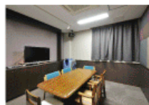
▲防音完備のカラオケルーム