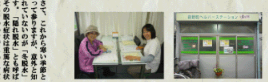
独自の地域福祉に特色を絞ったケアプラン。いっしょに暮らす存在です。