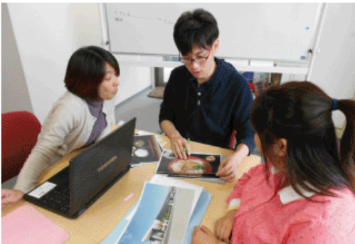
▲お食事はデザイナーズの魅力の一つ。スタッフとメニューを想定しながら食糧選びもセンスを活かして。