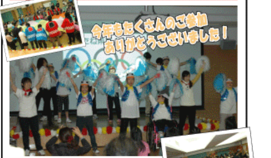
今年も忘くさんのご参加 高揚がどうございました!