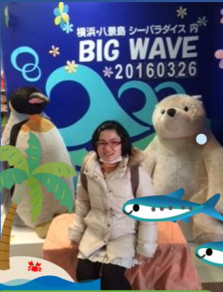
八景島シーパラダイス♪