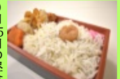
若葉ゆめの園 釜揚げしらす弁当

9月25日の昼食に出たのは「釜揚げしらす弁当」です。水戸駅で売られているお弁当がモデルになっています。特徴は、ご飯を覆いつくすしらすの上に大きい梅干しが存在感を出しています。煮物とから揚げがますます食欲をそそります。しらすの塩気が、ちょうどよ海の恵みを味わえるおいしいお弁当でした。10月は新潟の凸切符弁当(予定)です。楽しみます。