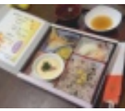
お祝い弁当 おいしそう！

特養・シヨートステイ・デイサービス各事業所で敬老の日のお祝いを行いました。 今年はずっと最後の敬老会ということですが、皆様がこの年号の時代も元気に過ごせるようにささやかながらお祝いとエールの気持ちをもって行わせていただきました。