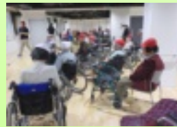
紅組と白組に分かれていざ決戦！

9月20日にあじさい1・2丁目のご入居者様と若葉ゆめの園の地域交流ホールにて「秋の大運動会」が行われました。紅組と白組に分かれ職員も入り、ボール運びや玉入れを行い、職員と一緒に白熱し、大盛り上がりで汗を流しました。結果は紅組が勝ちましたが、両組とも頑張りました。スポーツの秋、皆さんも童心に戻って楽しみました。