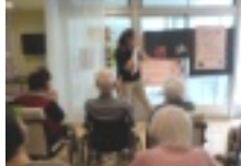
各ユニットで様々なイベントも