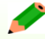
嘔吐物等処理研修