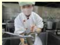
▲厨房業務が中心です

給食の請負業務（施設厨房業務の補助） 食堂運営（予定） 食堂業務の他、施設外就労や内職業務等も検討しております。