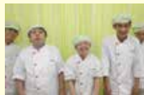
▲支え合う仲間がいます