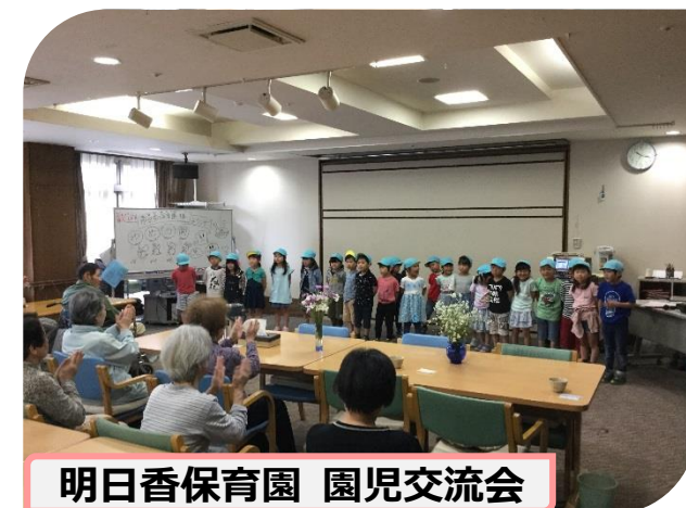
明日香保育園 園児交流会