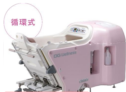
循環式 チェア浴槽