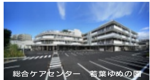
総合ケアセンター 若葉ゆめの園