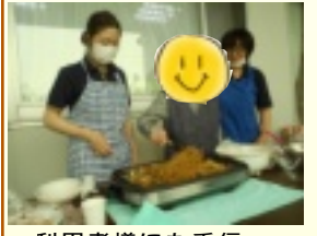
利用者様にも手伝っていただきました。さすが元主婦！

5月27日、ショートステイ中庭を使って、パーティ大会を行いました。ホットプレートで焼きそばやお肉と一緒に焼いていただきながら召し上がっていただきました。やはり皆さんと一緒に何んでもおいしいです。