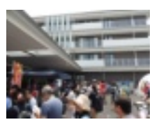
昨年の祭りの様子

7月21日(土) 『第2回納涼祭』 時間は：午前11時～午後2時 はじめに開催式典を行います。 雨天の場合は縮小、プログラムの変更 焼きそばやフランクフルトやかき氷などの食べ物屋台やゲームコーナーなども出店します。また豪華景品も当たるビンゴ大会も行います。 お誘いあわせの上、ぜひともお越しください。