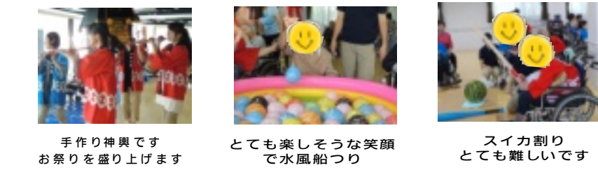
手作り神輿ですお祭りを盛り上げます とても楽しそうな笑顔で水風船つり スイカ割りとても難しいです

今年の夏もいろいろと思ひます。若葉ゆめの園では、いろいろな思い出になりました。これから